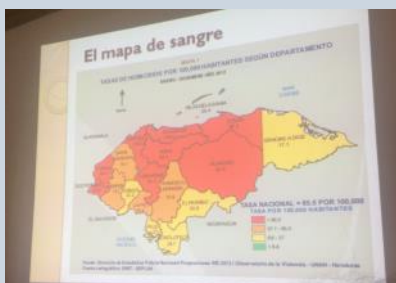
El papel de la Universidad y la cooperación internacional

El grupo de investigación participó igualmente en un seminario titulado “El papel de la Universidad y la cooperación internacional”.