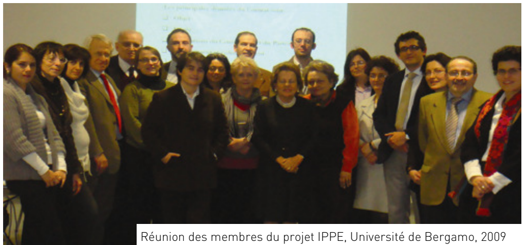
Réunion des membres du projet IPPE, Université de Bergamo, 2009

La catégorie des droits des parents dits « collectifs » tient essentiellement au droit de participation des parents dans les structures formelles organisées du système éducatif.